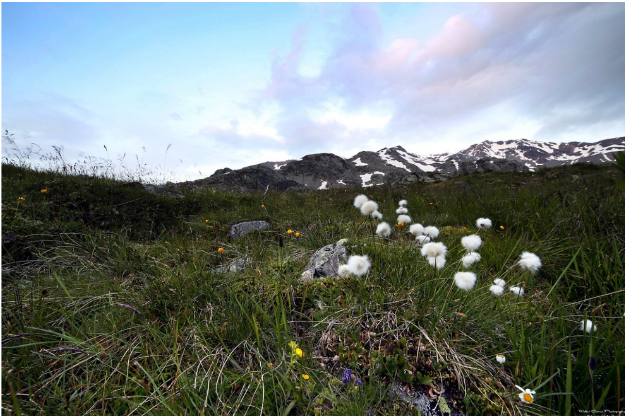
"VAL DI RABBI" BY WALTER.CORNO IS MARKED WITH CC BY-NC-SA 2.0.

Per prenotazioni ed informazioni contattare il Direttore di Escursione.